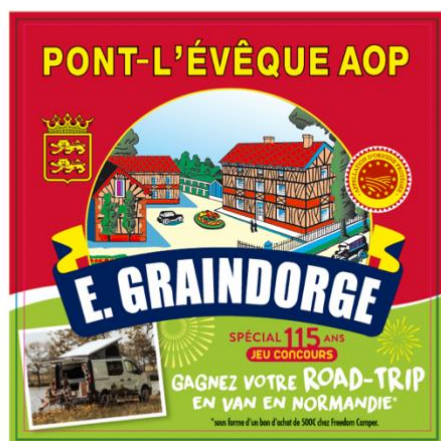
Étiquette de la boîte du Petit Pont-l'Évêque 220g.