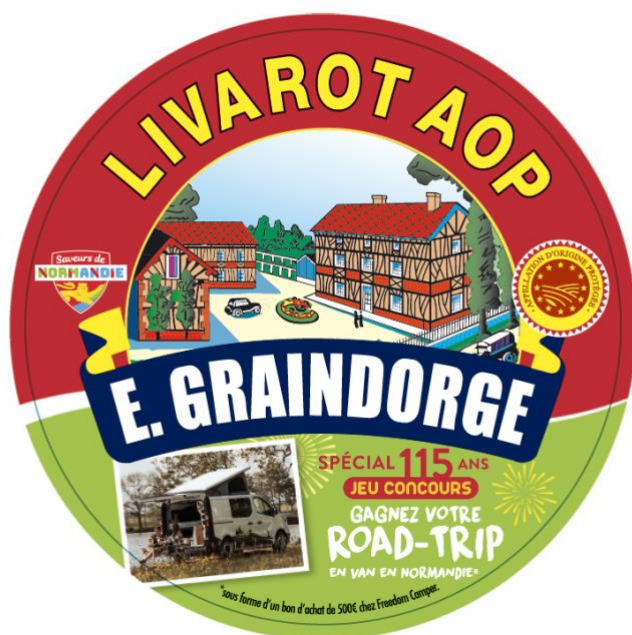
Étiquette de la boîte du Livarot 250g